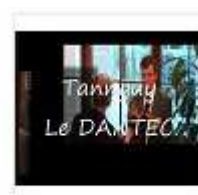
Management projet - COOPIL - Le dantec (2)