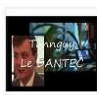
Management projet - COOPIL - Le dantec (1)