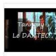
Management projet - COOPIL - Le dantec (2)