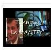
Management projet - COOPIL - Le dantec (1)